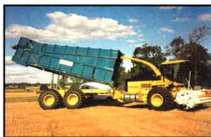
NH - FX finsnitter på CHAMPION ramme og transmission.