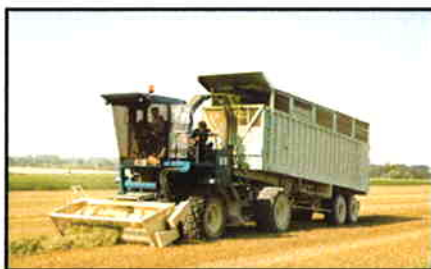
Trailer system med op til 65m 3 sættevognstrailer.

Bæreenheden kan efter ønske udstyres med fast monteret kasse med aflæsekæde, med sættevogn, med tipkasse med aflæsekæde, eller hvad der måtte være behov for. Men drivenheden kan også anvendes til andre formål som kræver stor trækraft med lav marktryk, f.eks. transport af store gyllemængder, roeoptagning og transport, gødningsudbringning m.m.