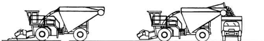
Fast monteret container op til 30 m 3 .