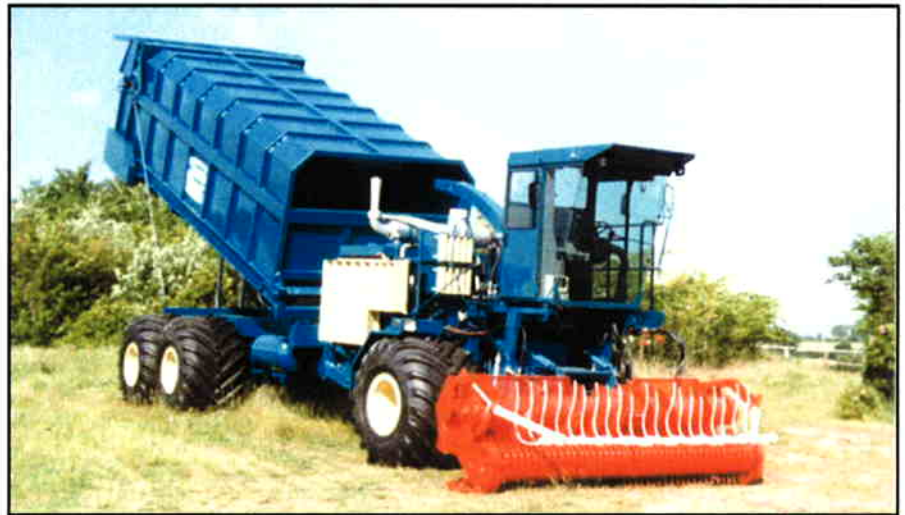
CHAMPION industrifinsnitter med 40 m 3 container, bagløft og aftømning med bundkæde.

Via instrumentpanelet, der rummer viserinstrumenter og advarselssignaler, advares føreren øjeblikkelig