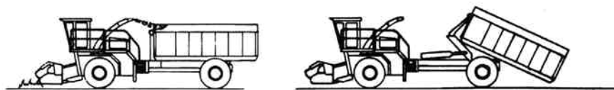
Af- og påsætning op til 35 m 3 container med kran.