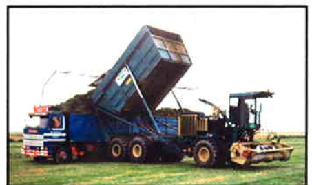
35 m 3 højtippcontainer med hydraulisk drevet bundkæde og aflæsning i 3,20 m. højde.