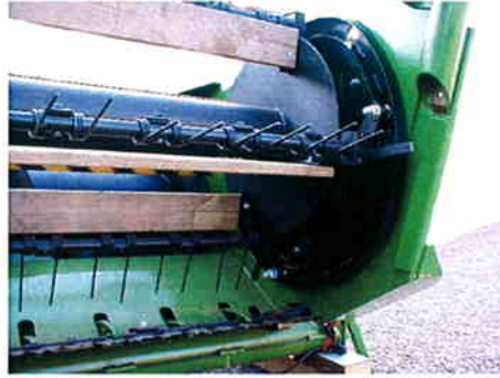
Lukket kulissestyr med bredbane lejer