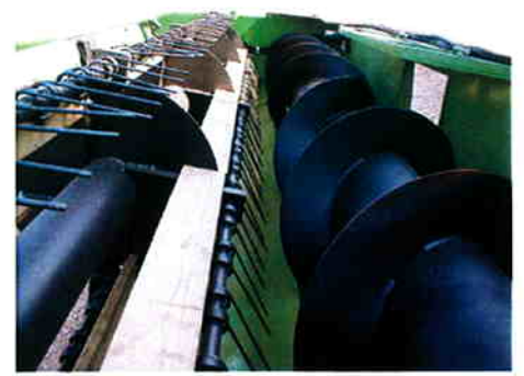
Kraftige vindefjedre i 6mm fjederstål