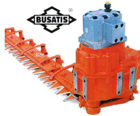
Busatis Bidux dobbeltknive med enkeltslag op til 1000/min. Justerbare føringsarme og trykfjedre. Mekanisk eller hydraulisk transmission op til 5,2m, hydraulisk op til 6,5m. Lukket oliebad drivstation, 2 udvendige arme og forbindelseslejer. 2 udvendige smørepumper interval 8. time.