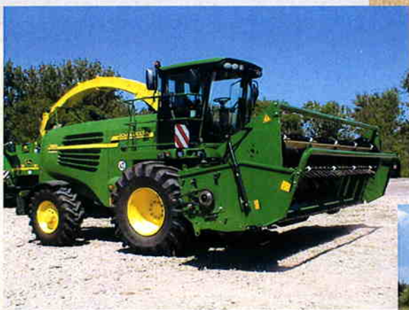
Champion skærebord type BB. Busatis dobbeltniv system op til 1000 dobbelte snit i minuttet. Arbejdsbredde 4,2 - 6,1m.