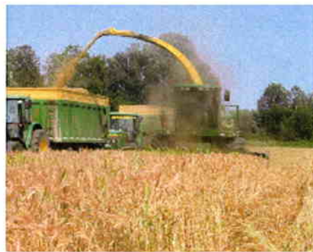
Champion BB510 skærebord i WPS afgrøde type Triticale/rajgræs mix.

Champion selvkørende skårlægger med 6,1 m BB skærebord med centerudlæg. Option sideudlæg med 2 x 6,1m i et 3m skår.