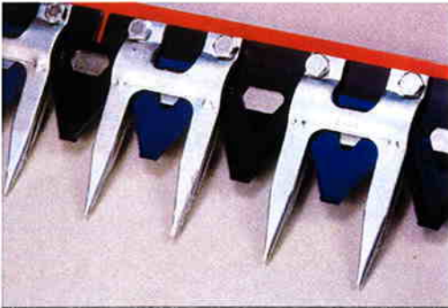
Schumacher knivsystem, enkeltkniv dobbelt slag 570 rpm eller enkelt kniv enkelt slag 650 rpm Rifledede knive, fin eller grov, selvrensede kombineret med stålfigre og styreruller på hele arbejdsbredden