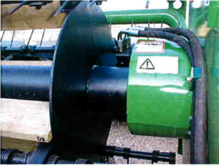
Hydraulisk variabel transmission for vinde