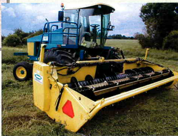
Champion selvkørende skårlægger, monteret med Champion BB610 skærebord, udstyret med centerudlæg og lucerne udstyr.