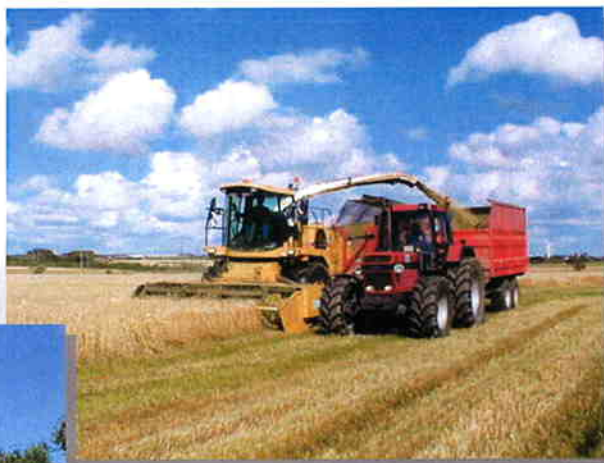
Champion skivebord type ZM, zenter-søgende. Arbejdsbredde 4,1 og 4,9m.